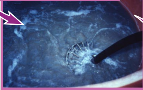
マックティエス マイクロープ の活性化液